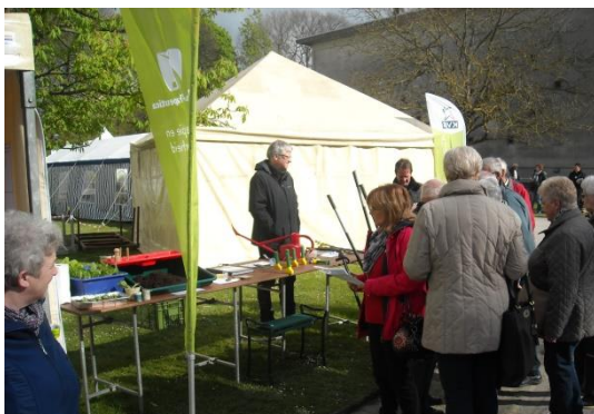
Stand van Terra-Therapeutica op de KVG Familiedag

Op 23 april hadden we een informatiestand op de familiedag van de KVG (Katholieke Vereniging Gehandicapten) in de Plantentuin van Meise. Daar hebben we gemerkt dat de belangstelling voor de laagdrempelige activiteiten groot is, dat er veel interesse is voor aangepast en licht tuinmateriaal maar dat we niet kunnen concurreren met de eetstandjes! Volgende maal moeten we misschien eetbare planten meenemen.