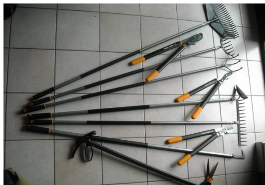
Demonstratiemateriaal dat we kregen van de firma Fiskars