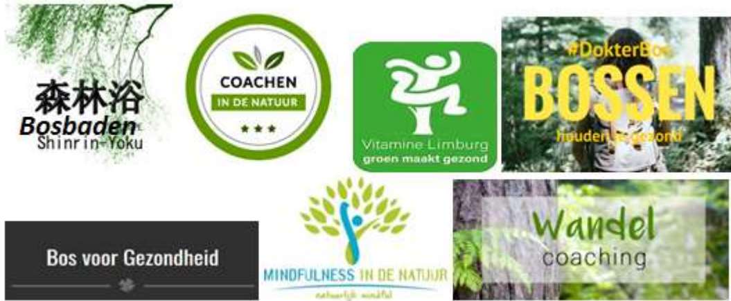
Schema 3: diverse initiatieven “binnen Groen en Gezondheid” in Vlaanderen

Groene zorg is een kleine biotoop binnen het geheel van ‘Groen en Gezondheid’, een te beschermen sector die dreigt ondergesneeuwd te raken binnen de wildgroei aan initiatieven.