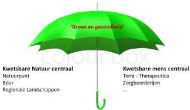
Schema 1: Groen en gezondheid in Vlaanderen